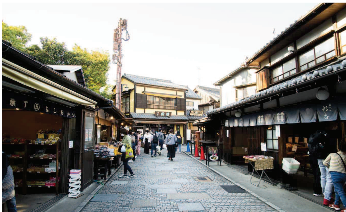
菓子屋横丁（川越市）