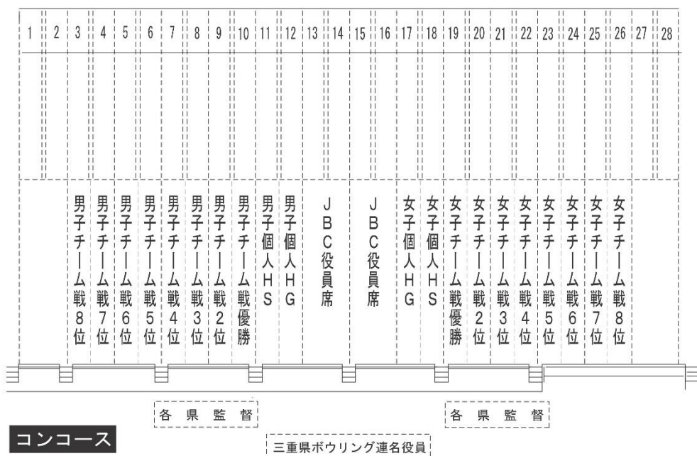
表彰式・閉会式図